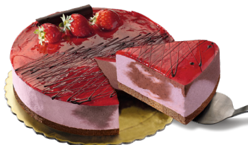
Σοκολάτα - Φράουλα