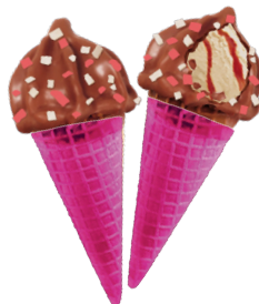
Φρούτα του Δάσους