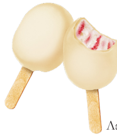
Λευκή σοκολάτα με Βύσσινο