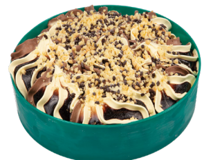
Κρέμα Μιλφέγι με Σοκολάτα