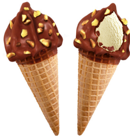
Βανίλια με Αμύγδαλο