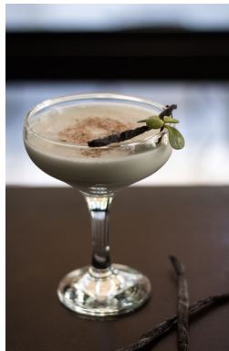
FIOR DI LATTE VODKA