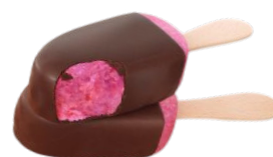
Γρανίτα Φράουλα με επικάλυψη Σοκολάτα Υγείας