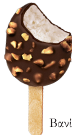
Βανίλια & Αμύγδαλο